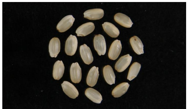
高温登熟性の弱い系統