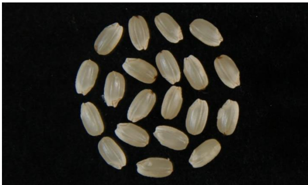
高温登熟性の強い系統