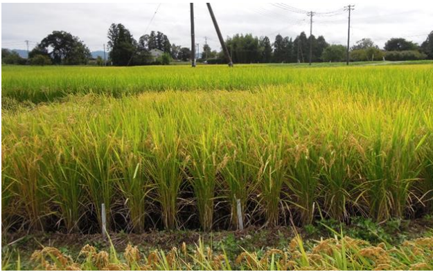
現地試験(仙南地域)

また、DNAマーカー開発のため、「東北234号」(高温登熟性“強”)と「初星」(高温登熟性“弱”)の分離集団及び戻し交雑集団を用いて、高温登熟性に関する遺伝解析を行う。